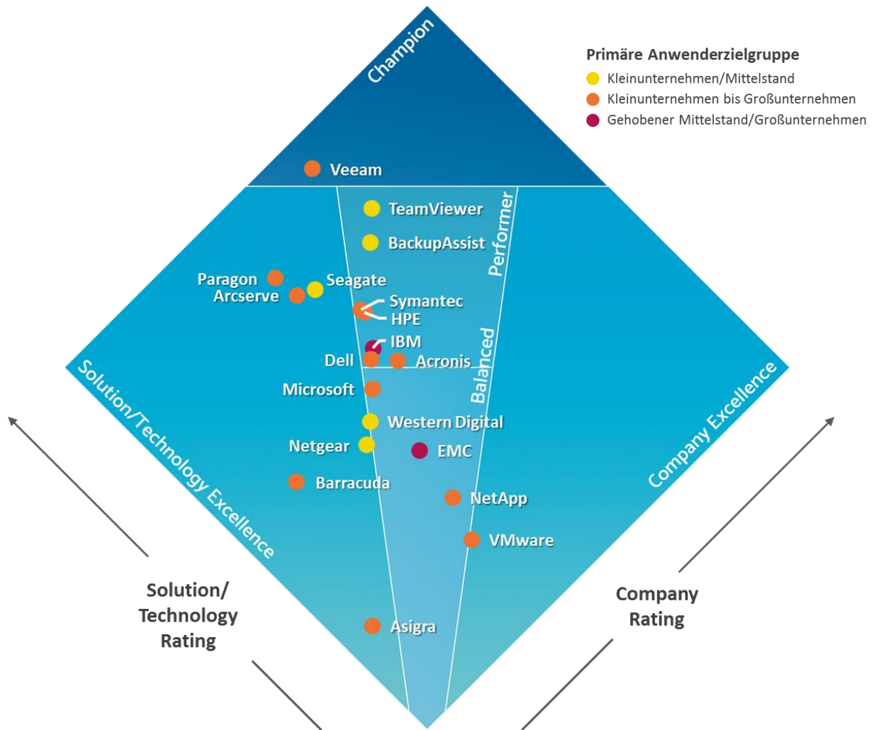
Abbildung 1: PUR-S Diamant Backup & Recovery

Im Rahmen des Lösungsbereichs Backup & Recovery erhält die Lösung BackupAssist aus dem Hause Cortex I.T. die Auszeichnung High Performer . Als Unternehmen konnte BackupAssist-Hersteller Cortex I.T. mit einer sehr guten Leistung punkten und die Kunden von der Qualität der Lösung vollumfänglich überzeugen.